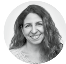
Catherine, 45 ans Propriétaire d'entreprise

Bénéficiez d'une assurance permanente qui permet de minimiser l'impôt, de maximiser la valeur successorale nette grâce au compte de dividende en capital et d'impacter positivement le bilan financier de votre société. En effet, la valeur de rachat de votre police pourra être considéré comme un actif au bilan de votre société. Après quelques années seulement, la forte croissance des valeurs de rachat de la police renforcera votre bilan et vous permettra d'inscrire un revenu à l'état des résultats.